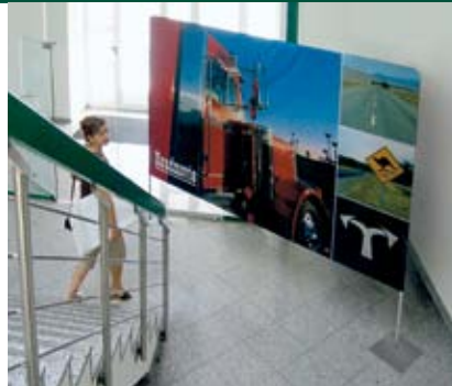
Display Wand Basic