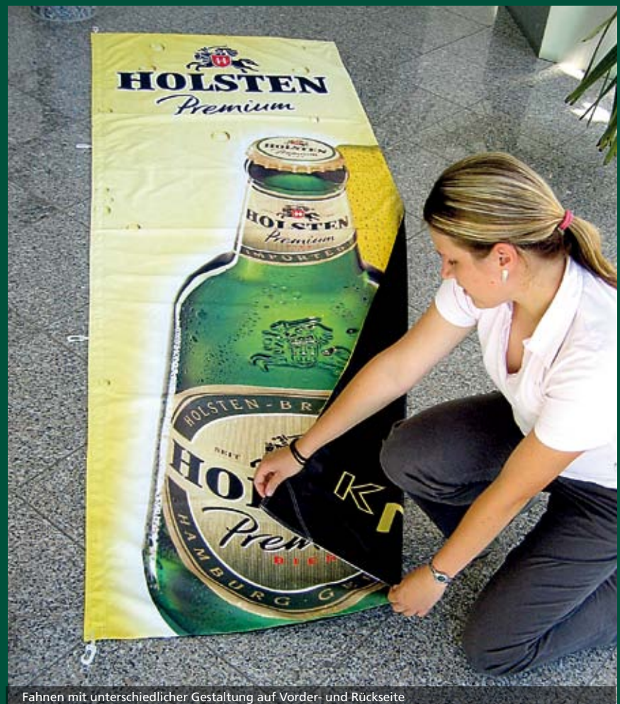
Fahnen mit unterschiedlicher Gestaltung auf Vorder- und Rückseite